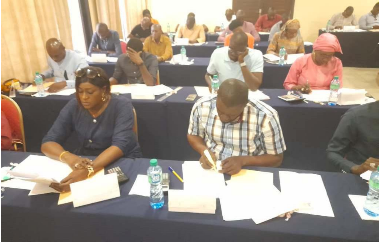
Photo des participants en salle d'examen

Dans l'ensemble les cours et les examens se sont très bien déroulés comme le témoignent quelques participants aux formations.