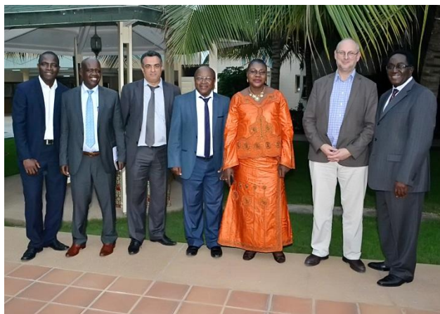
Photo des membres actuels du CA