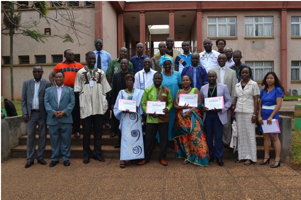
Photo des participants UCAC-2015

La session de formation de Master en « Management des Institutions Microfinance » (MAIN & UCAC) session 2015 a été globalement bien organisé et a répondu à l'attente des participants