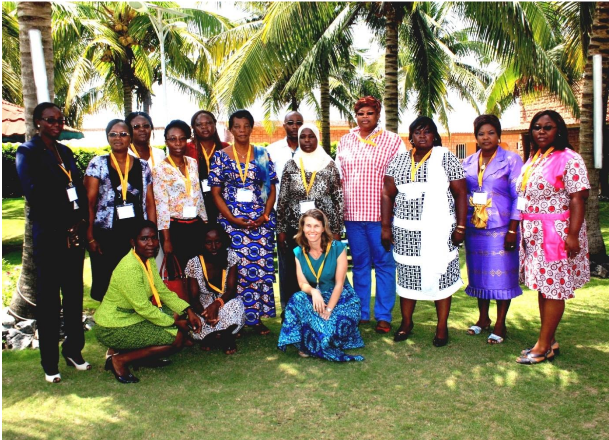
Photo de groupe