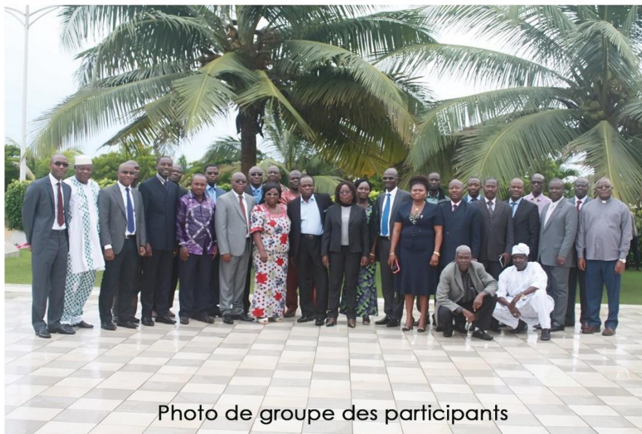
Photo de groupe des participants

L'objectif principal de ce cours est d'apporter aux participants une méthodologie et des outils pour les appuyer dans l'élaboration et dans la gestion de projets en microfinance communautaire.