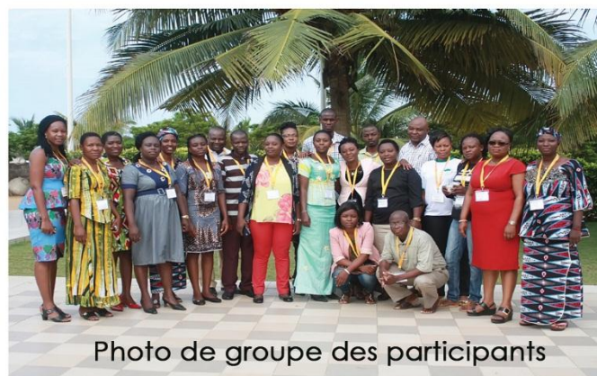
Photo de groupe des participants