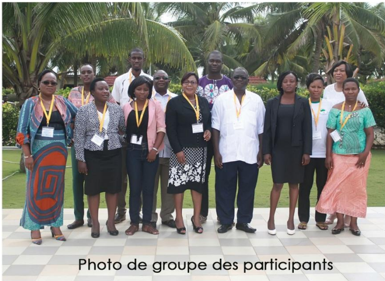
Photo de groupe des participants

Dans le cadre du renforcement des capacités des acteurs et utilisateurs de l'approche VSLA, un atelier de formation sur le SIG-SAVIX s'est tenu du 12 au 16 Septembre 2016 à Lomé au Togo. Cette formation a été organisée par le MAIN (Microfinance African Institutions Network) en collaboration avec Carsey School of Public Policy de l'University de New Hampshire, Plan International WARO et VSL Associates.